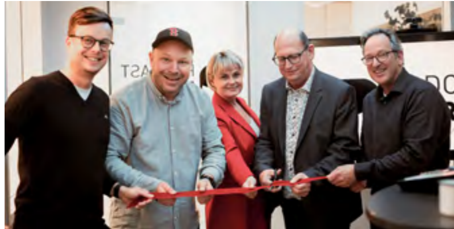
So sieht Eröffnungsfreude aus!

Die ams Podcastfabrik hat ein neues Podcaststudio eröffnet. Der ostwestfälische Spezialist für Unternehmenspodcasts zieht pünktlich zum 5. Geburtstag ein.