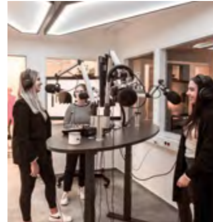
Audio-Aufnahmen mit bis zu vier Personen möglich.